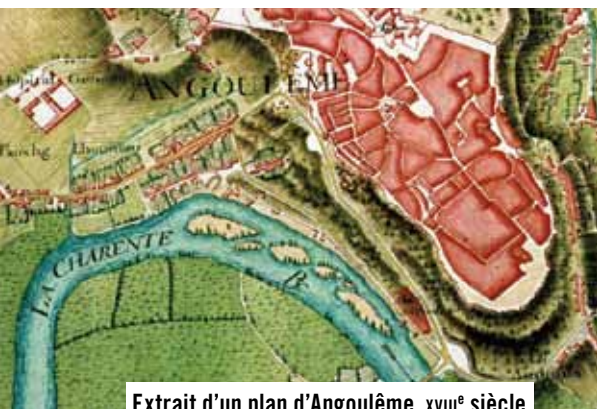
Extrait d'un plan d'Angoulême, XVIII e siècle.

Depuis 1280 le port de l'Houmeau s'est développé au pied des remparts de la ville grâce au commerce du sel, de l'eau-de-vie, du papier, du safran puis des canons. Bénéficiant de la proximité de la Charente, le quartier fut longtemps le poumon économique d'Angoulême comme en témoigne son remarquable patrimoine fréquenté par d'illustres voyageurs tel Napoléon I er , route de Paris oblige !