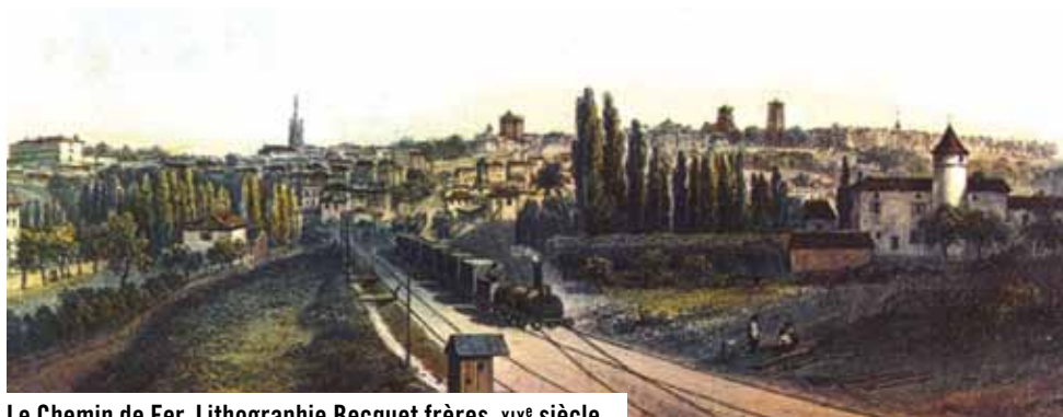
Le Chemin de Fer. Lithographie Becquet frères, XIX e siècle.

autour des gares ferroviaires. Gravement touché par les bombardements alliés de juin 1944, le quartier bénéficia de la construction en 1949 d'une passerelle vers l'île de Bourguines où fut implantée en 1959 la première piscine d'Angoulême puis l'auberge de jeunesse, le camping et le célèbre festival des Musiques Métisses.