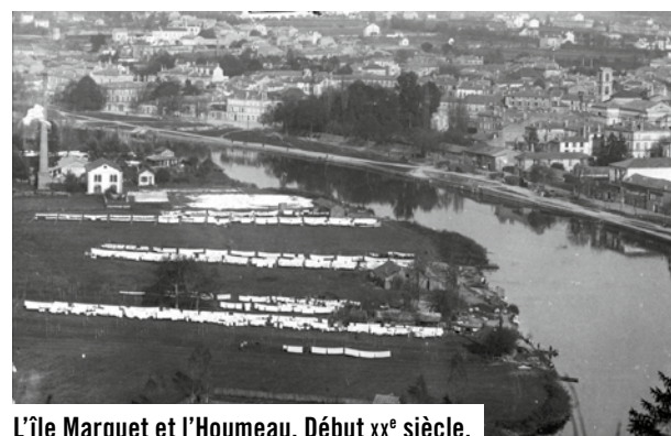
L'île Marquet et l'Houmeau. Début XX e siècle.

Quant à l'église Saint-Jacques élevée au XIX e siècle par l'architecte Paul Abadie père dans un style néoclassique, elle remplace un édifice médiéval. La place qui la précède vient de faire l'objet d'une belle réhabilitation. D'importants témoignages architecturaux du couvent des Carmes subsistent rue de Paris, ce sont en partie aujourd'hui les locaux de l'école Sainte-Marthe Chavagnes. Il convient aussi de citer la vierge sculptée de la rue du Gond et la gare SNCF qui n'est autre que l'ancienne école de Marine construite sous la Restauration à la demande de Louis-Antoine de Bourbon, duc d'Angoulême. Enfin le FRAC offre sur les quais une belle ouverture vers l'art contemporain.