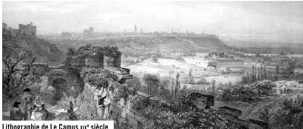
Lithographie de Le Camus XIX e siècle.

Le fleuve Charente est le premier trésor de l'Houmeau. Ses berges comme ses îles constituent un remarquable ensemble naturel très préservé. Mais le quartier a aussi la chance d'abriter un patrimoine urbain de qualité tels ces beaux hôtels particuliers établis sur les quais. Comment ne pas citer la « Capitainerie » qui abrite