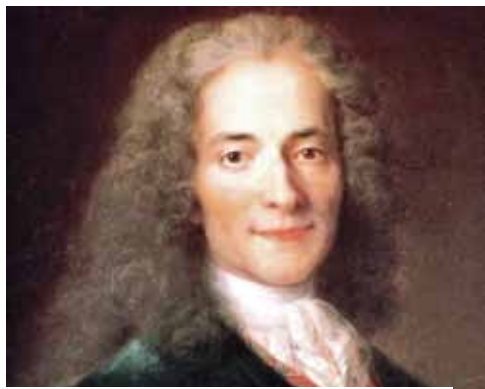
Portrait de Voltaire par C. Lusurier, XVIII e siècle.

La position de l'Houmeau sur la route de Paris a permis au quartier de voir passer bon nombre de célébrités notamment Voltaire qui fit étape à Angoulême. Après un succulent repas à l'auberge de la table royale, il visita le gouverneur du château et