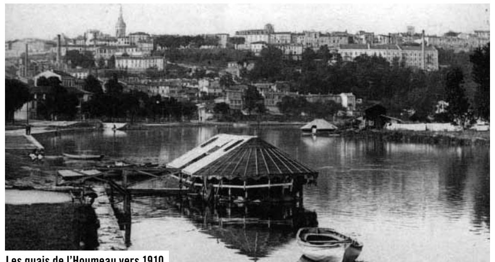
Les quais de l'Houmeau vers 1910.

collège de la Marine (la gare SNCF aujourd'hui) obligeant les aspirants à ramer sur la Charente.