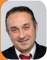
Philippe Lavaud maire d'Angoulême

V ous tenez en main le premier numéro de La Lettre de l'ORU Basseau – Grande Garenne . L'Opération de Renouvellement Urbain avance. Progressivement, les contours du nouveau quartier se dessinent, les chantiers se succèdent, les études sont en cours. Ces études ne sont pas la partie la plus visible de cette opération ambitieuse mais elles sont nécessaires.