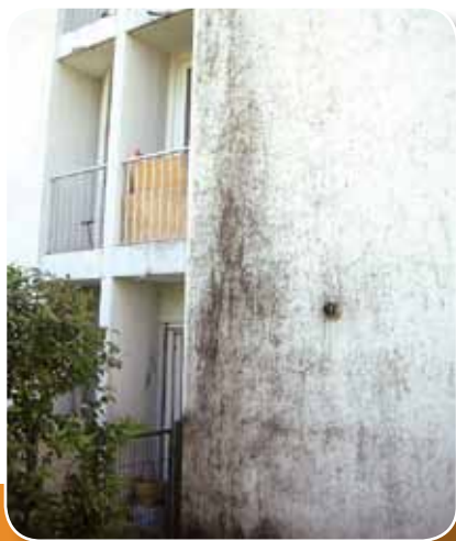
Immeuble « ESPOIR », rue de la Charité, avant travaux. visuel O.P.H. de l'Angoumois.

pose d'une isolation extérieure et une chaudière à condensation, ce qui permettra de très fortes économies d'énergie.