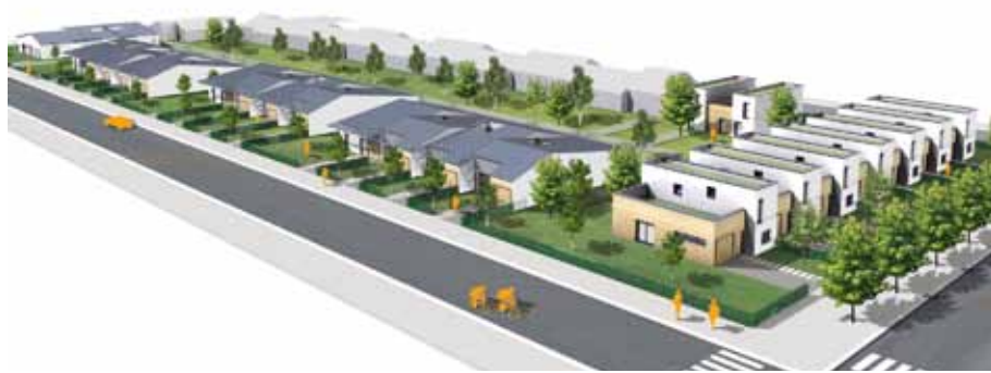
Projet de 24 maisons « location-accession » - Document : Gautier+Conquet et Golem Images

N'hésitez pas à contacter Logélia Charente au 05 45 38 66 03 pour plus d'informations.