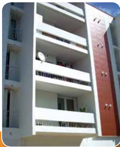
Immeuble « ESPOIR », rue de la Charité, après travaux.