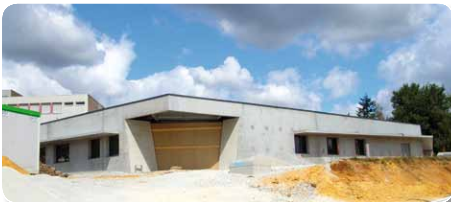
Etat de construction de la M.D.S., début août 2010

maire-adjoint à la démocratie locale et à l'accessibilité